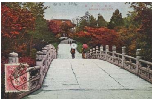
02. Kyoto, Nishi Otani. Editore: Asahidō, Kyoto. 10 giugno 1930. Cromolitografia.