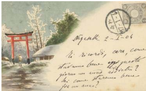
01. Torii. 2-4 gennaio 1904. Illustrazione dipinta a mano.

Ogni immagine deve essere accompagnata dalla propria didascalia e dal copyright: ©2021MUSEC/Fondazione Ada Ceschin e Rosanna Pilone Pilone