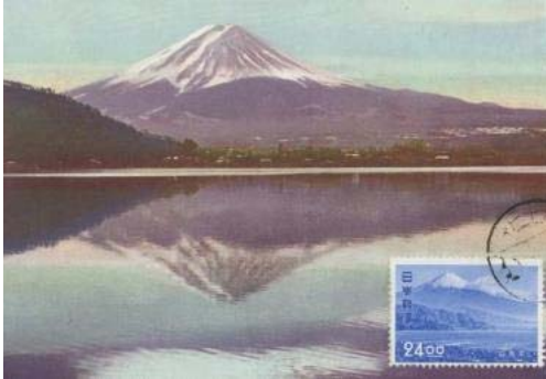
03. Monte Fuji . Editore: Benridō per il Japan Travel Bureau. 1918-1945. Cromolitografia