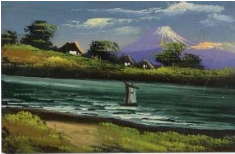
12. Monte Fuji . 1918-1933. Dipinta a mano con colori a olio.