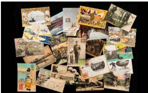
13. Un collage di cartoline della Collezione Ceschin Piloni